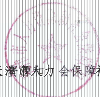
天津市人力资源和社会保障局