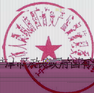
天津市人民政府国有资产监督管理委员会