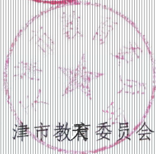
天津市教育委员会