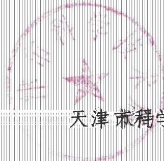
天津市科学技术局